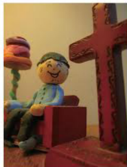
光圈 2.8 快門、1/80 秒，ISO 800 感光度增加 3 檔，快門時間縮短 3 檔，就算未帶腳架，也仍然能夠穩定拍攝。

一般相機的 ISO 感光度從 80 到 1600 以上不等，手動強制調高能增加相機對光線的敏感度，縮短快門時間，減少畫面模糊的機會。不過 ISO 值愈高，照片的雜訊就愈大，攝影者必須依實際情況自行取捨。因此周遭環境如果沒有特別陰暗，只要置於自動即可。